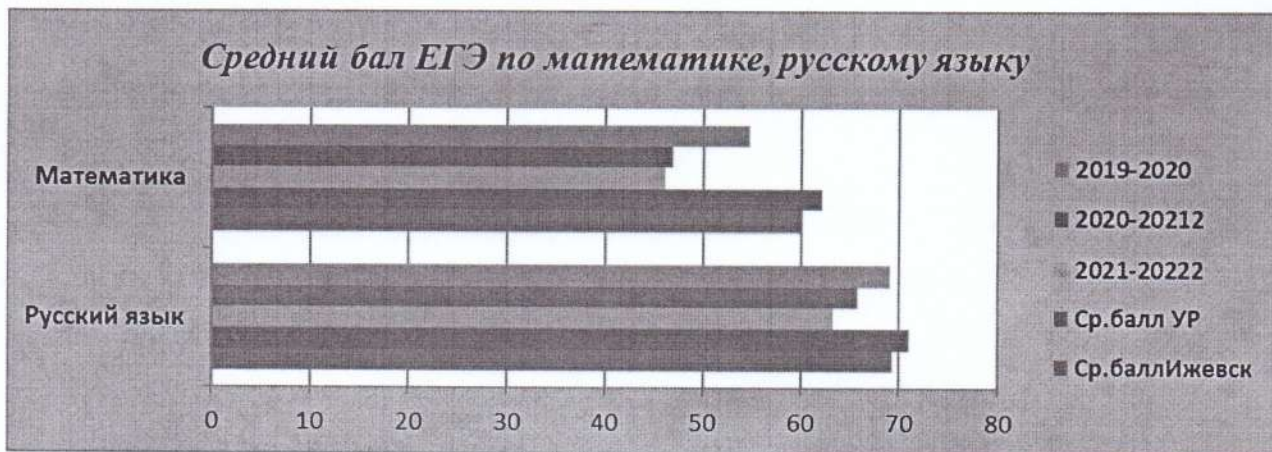
Средний балл по школе по итогам ЕГЭ